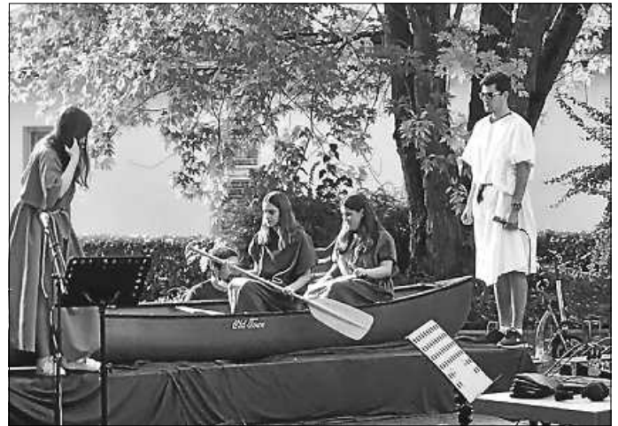
Der sinkende Petrus