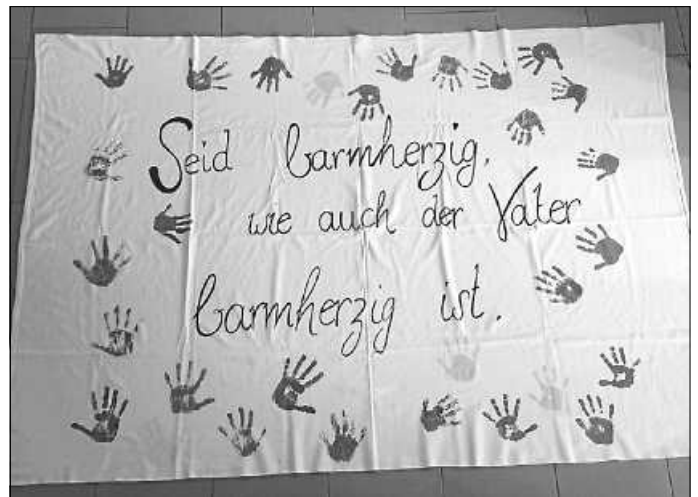
DFZ-Kinder haben ihre Spuren hinterlassen