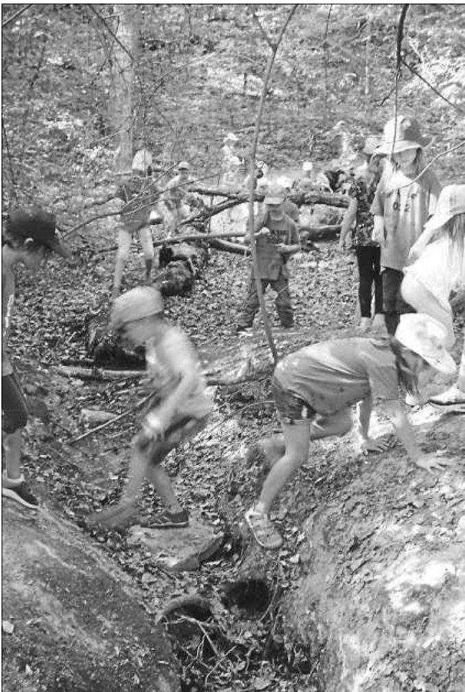
War schön mal wieder alle zusammen im Wald. Und jeder (besonders auf dem Rückweg) jeden motiviert hat. Ihr seid klasse gelaufen – Respekt!!!