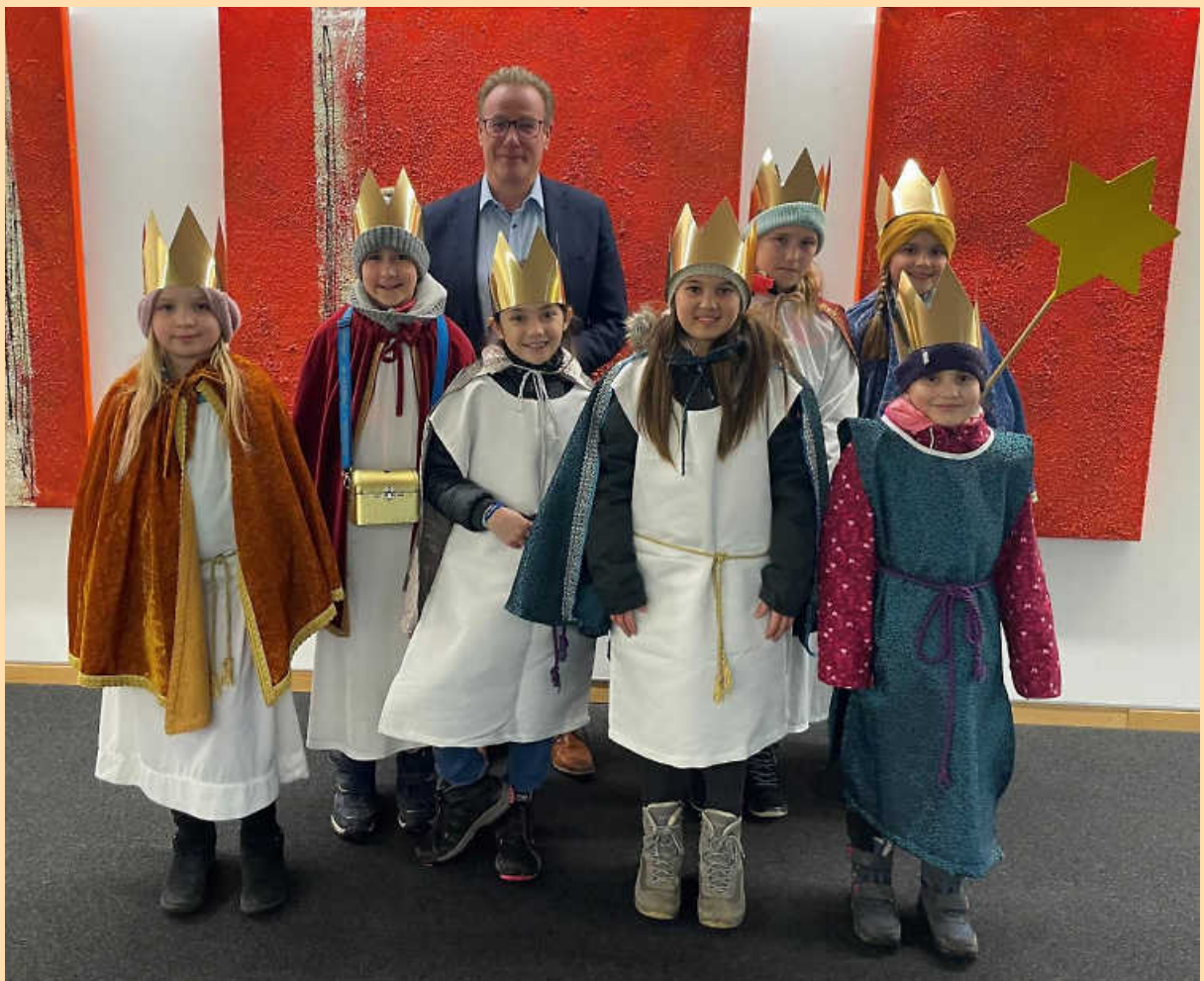
Sternsinger und Bürgermeister Steffen Döttinger

Wir wünschen allen Bürgerinnen und Bürgern ein schönes und friedliches neues Jahr.