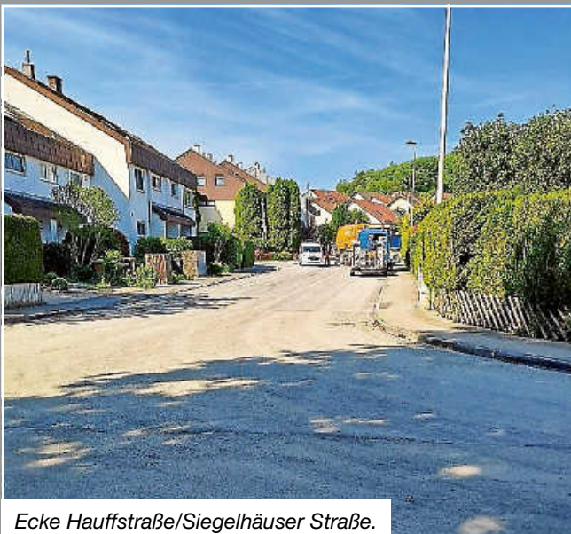
Ecke Hauffstraße/Siegelhäuser Straße.

Ein Bürger hatte in der Fragestunde der Gemeinderatssitzung im April darum gebeten, dass auch der aufgeplatzte Asphalt auf dem Gehweg neben den Grünstreifen in der Straße Dorfwiesen gerichtet wird. Diese Anregung wurde aufgenommen und mit den Sanierungsarbeiten umgesetzt.