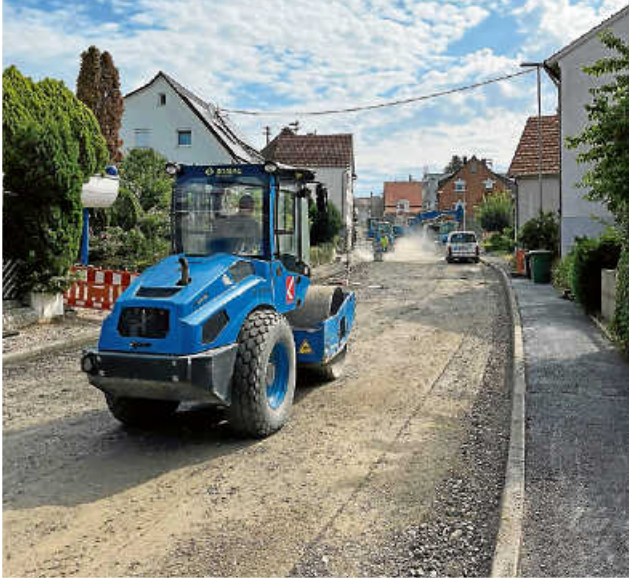
Eine Walze hat die Straße für die Asphaltierung vorbereitet.

Die Zufahrt zu den dortigen Grundstücken ist während der Arbeiten nicht gewährleistet. Die Baufirma Klöpfer hat die betroffenen Anwohner schriftlich informiert und sie gebeten, ihr Fahrzeug vorab außerhalb dieses Bereichs zu parken. Auch die Müllabfuhr ist derweil nur eingeschränkt möglich. Die Tonnen müssen an einer anfahrbaren Stelle, zum Beispiel in der Lange Straße, abgestellt werden. Die Baustelle insgesamt wird voraussichtlich Ende Juli abgeschlossen.