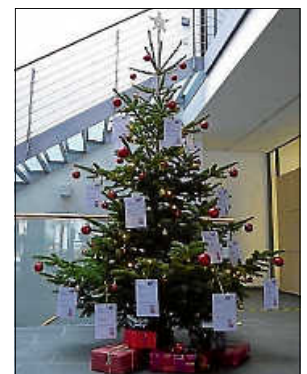
Weihnachtswunschbaum im Rathaus

Weihnachtswunschbaum-Team der Gemeinde Affalterbach und des Gewerbe- und Handelsvereins Affalterbach