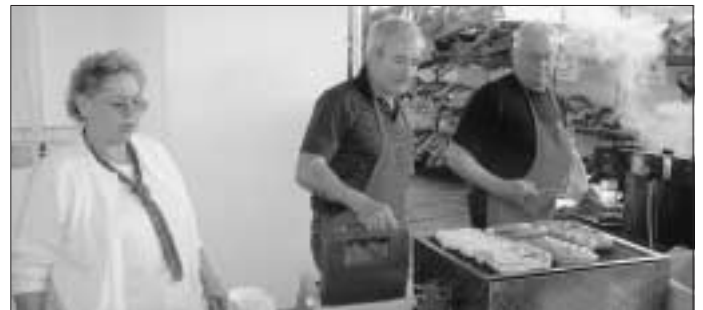
Die Alterswehr hatte die Wanderung und die Verpflegung in gewohnter Weise organisiert.