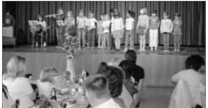
Vorführung der Apfelbachschule