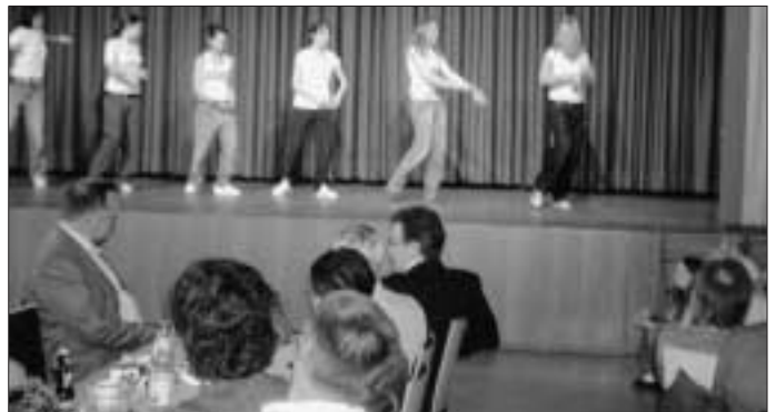
TSV Abteilung Jazzgymnastik