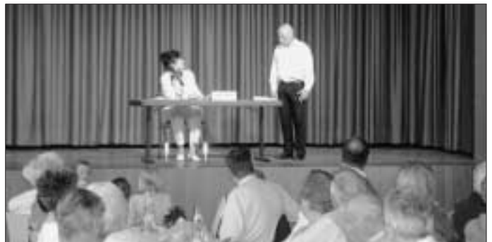
Sketch der Theaterfreunde "Die Lemberger"