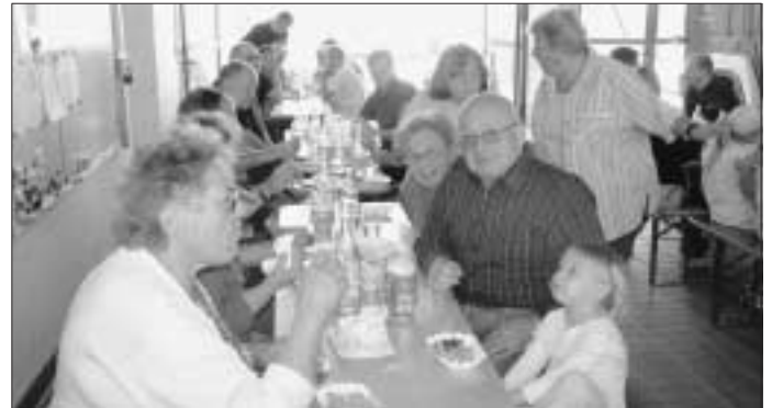
Gekühltes und Gegrilltes sorgten für eine Stärkung der Wanderer.