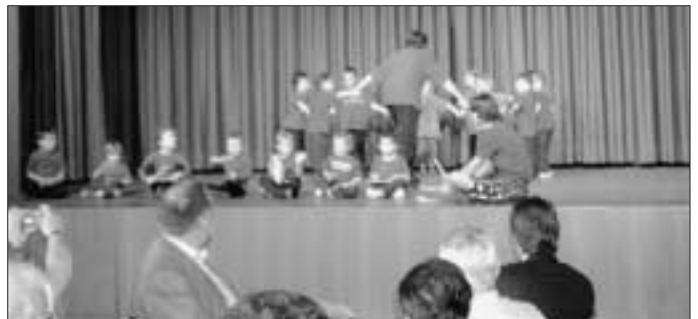
TSV Abteilung Kinderturnen