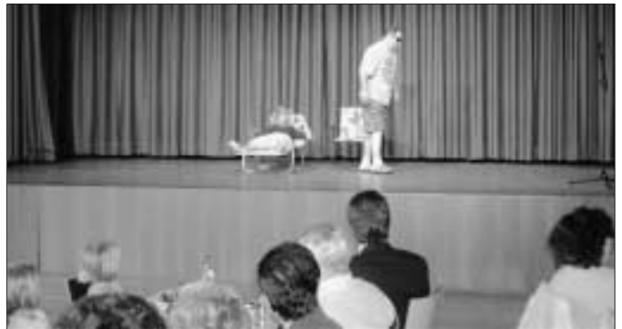
Sketch der Theaterbühne "D'Gerstenlupfer"